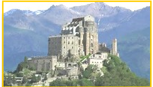
Sacra di San Michele